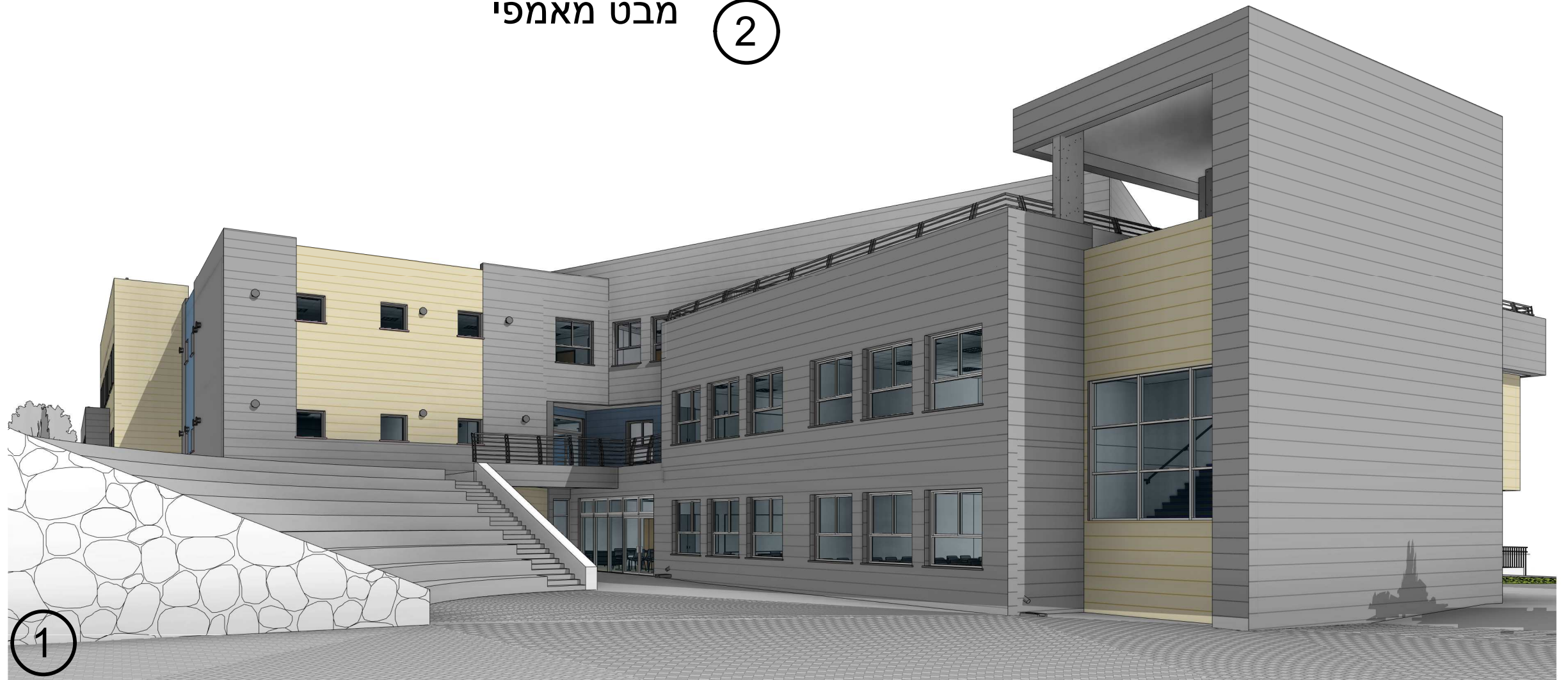
מבט מאמפי ②